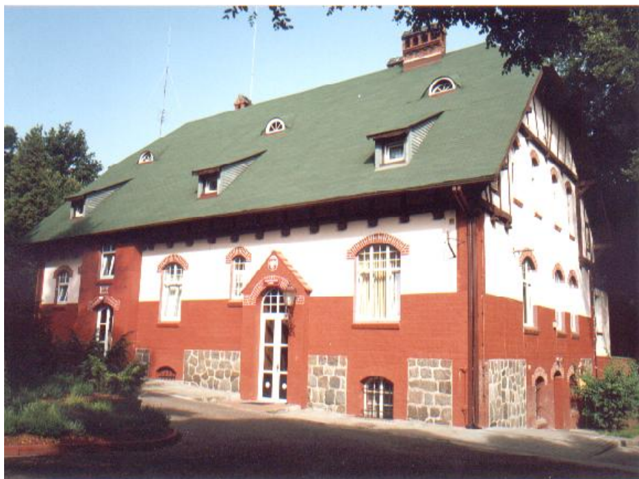
Budynek administracji leśnej z pocz. XX w. w zabytkowym parku z okresu XV w. w Sarbka.