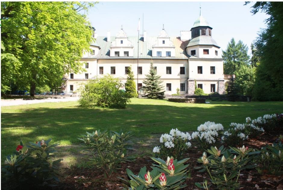
Zespół Pałacowo - Parkowy neorenesansowej rezydencji jednej z najznakomitszych arystokratycznych ówczesnych Bolka Emanuela von Hochberg Annemarie von Arnim. Architektura nawiązuje do późnorenesansowego zamkowego w Varenholz w wnętrzach zachowały się części dawnego wyposażenia.