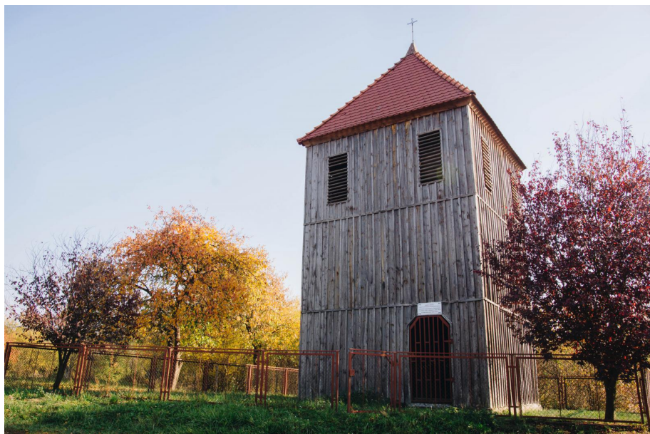
Dzwonnica drewniana z pierwszej połowy XIX wieku z 1824 roku