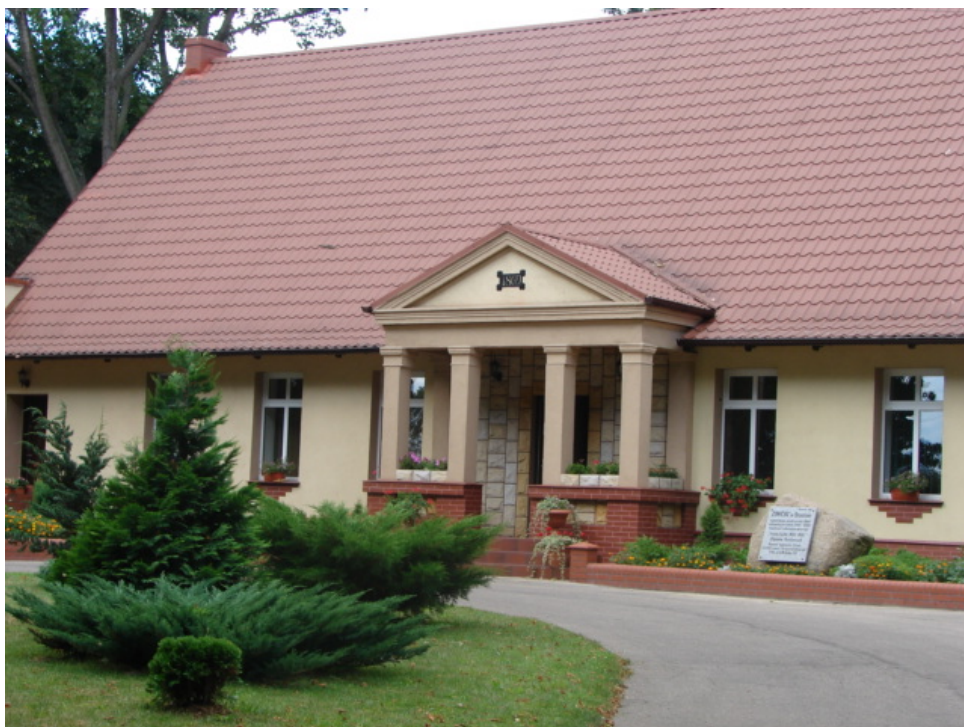
Park dworski, dwór i of

BRZEŻNO Wieś szlachecka Brzezno położona była w 1580 roku w powiecie poznańskim. W latach 1975–1998 miejscowość należała administracyjnie do województwa pilskiego. Od czasów staropolskich wieś należała do zacnego rodu Czarnkowskich herbu Nałęcz.