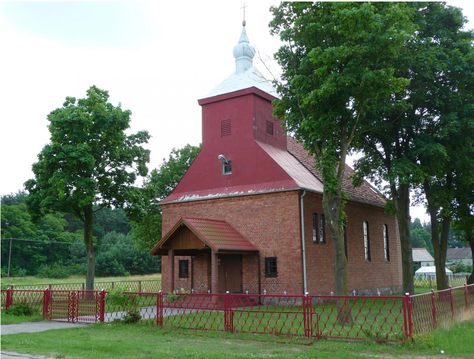
Neoromański kościół z